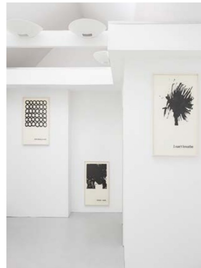
Ausstellungsansicht | Klaus Mosettig – es geht vorbei | Raum II exhibition view | Klaus Mosettig – es geht vorbei | Space II

Klaus Mosettig's first solo show at artemari is also the first presentation of this international artist to take place in Graz since 2006.