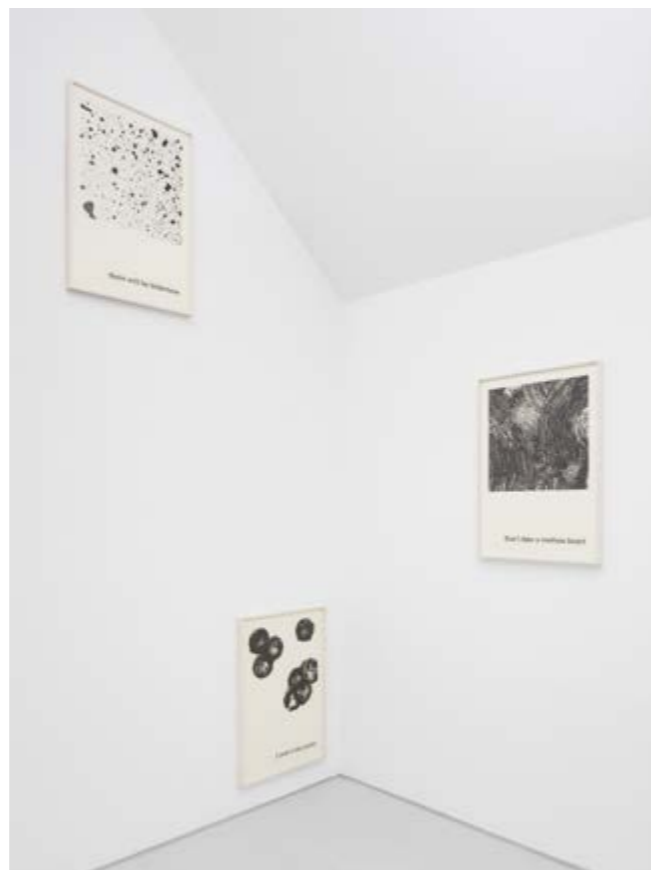
Ausstellungsansicht | Klaus Mosettig – es geht vorbei | Raum II exhibition view | Klaus Mosettig – es geht vorbei | Space II

Die erste Einzelausstellung von Klaus Mosettig bei artemari ist gleichzeitig auch die erste Präsentation des international tätigen Künstlers in Graz seit 2006.