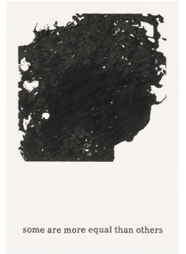
Typeface Corona 22 | 2020 | Bleistift auf Papier | 88 x 61 cm | gerahmt Typeface Corona 22 | 2020 | pencil on paper | 88 x 61 cm | framed