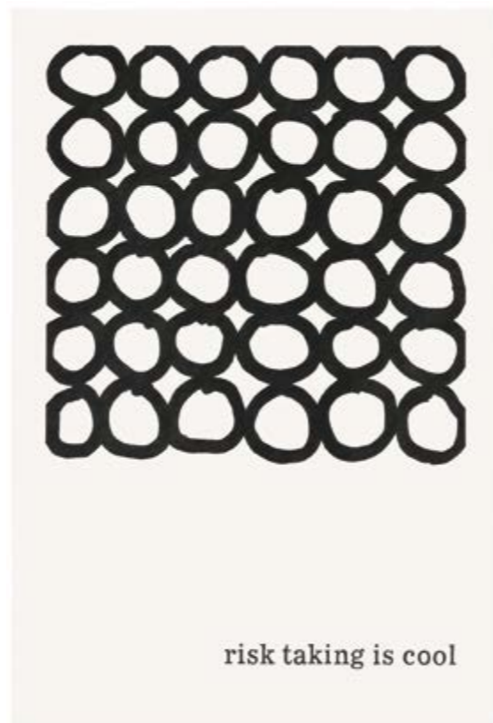
Typeface Corona 50 | 2021 | Bleistift auf Papier | 88 x 61 cm | gerahmt Typeface Corona 50 | 2021 | pencil on paper | 88 x 61 cm | framed