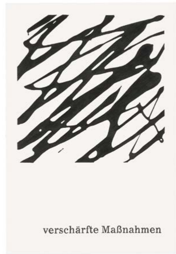
Typeface Corona 16 | 2020 | Bleistift auf Papier | 88 x 61 cm | gerahmt Typeface Corona 16 | 2020 | pencil on paper | 88 x 61 cm | framed