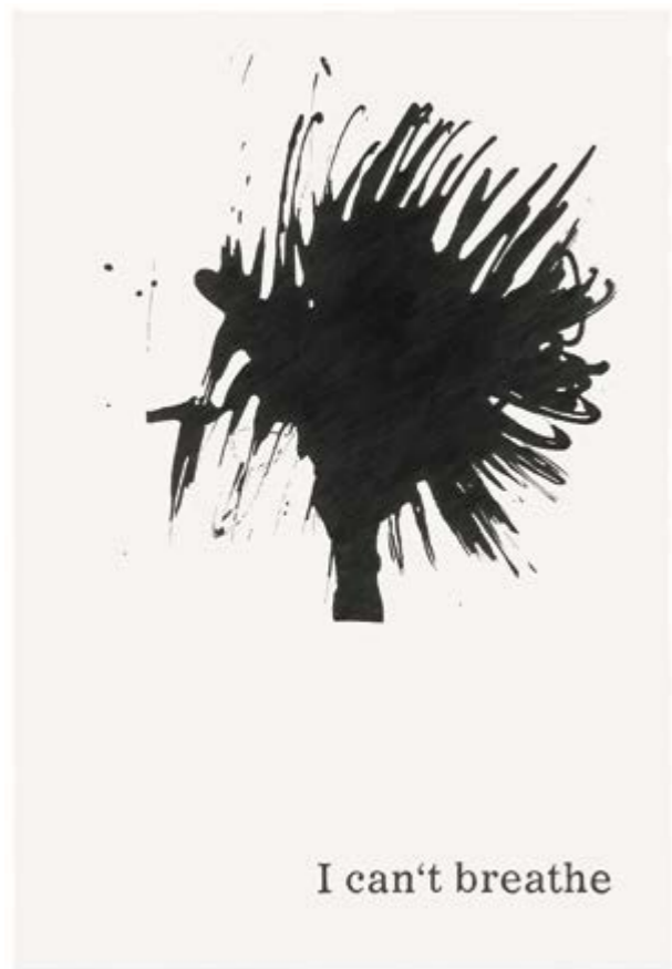
Typeface Corona 01 | 2020 | Bleistift auf Papier | 88 x 61 cm | gerahmt Typeface Corona 01 | 2020 | pencil on paper | 88 x 61 cm | framed