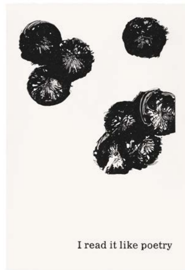
Typeface Corona 52 | 2021 | Bleistift auf Papier | 88 x 61 cm | gerahmt Typeface Corona 52 | 2021 | pencil on paper | 88 x 61 cm | framed