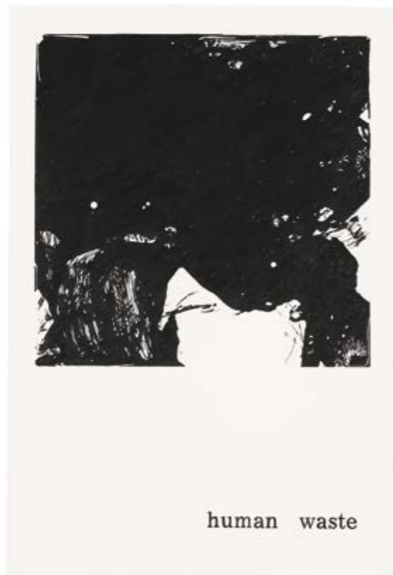
Typeface Corona 39 | 2021 | Bleistift auf Papier | 88 x 61 cm | gerahmt Typeface Corona 39 | 2020 | pencil on paper | 88 x 61 cm | framed