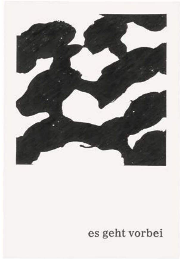
Typeface Corona 18 | 2020 | Bleistift auf Papier | 88 x 61 cm | gerahmt Typeface Corona 18 | 2020 | pencil on paper | 88 x 61 cm | framed