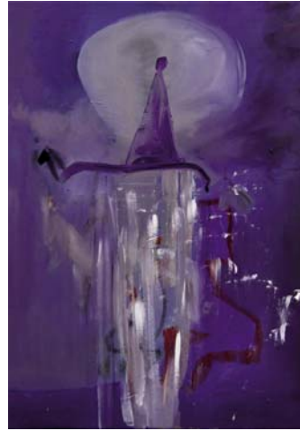
o.T., (Gnom), 2011, Öl auf Leinwand, 66 x 47 cm