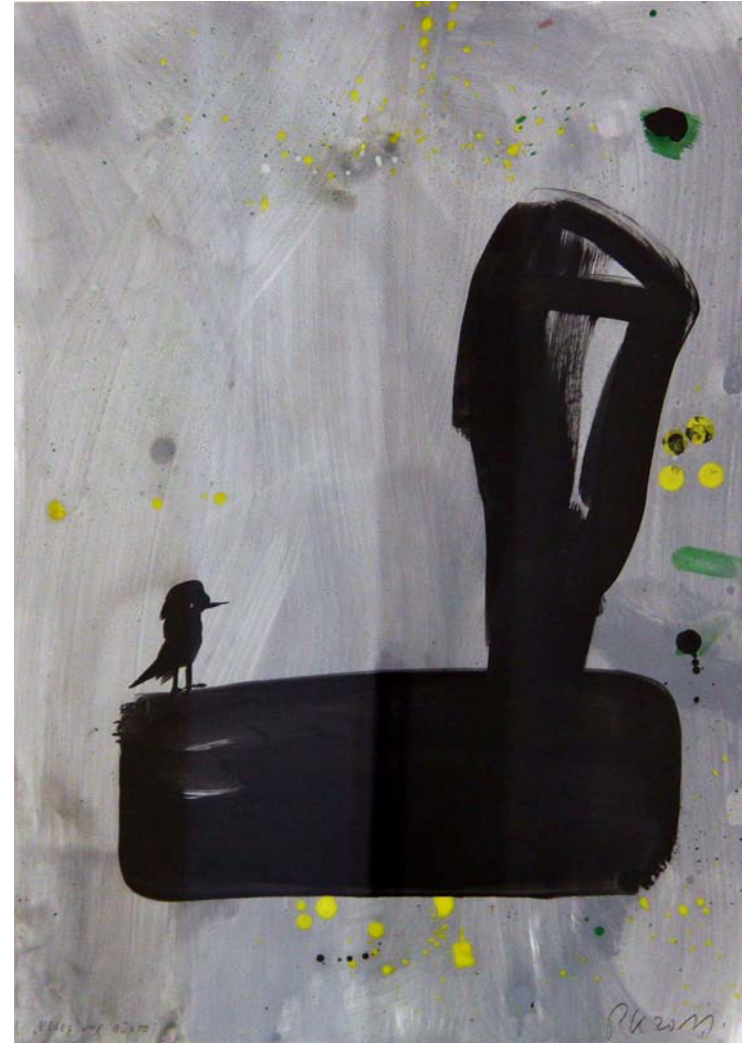
Vogel und Büste, 2011, Öl auf Papier, 60 x 42 cm