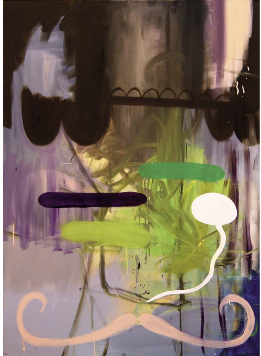
o.T. (Schnurrbart und Blase), 2011, Öl auf Leinwand, 140 x 100 cm