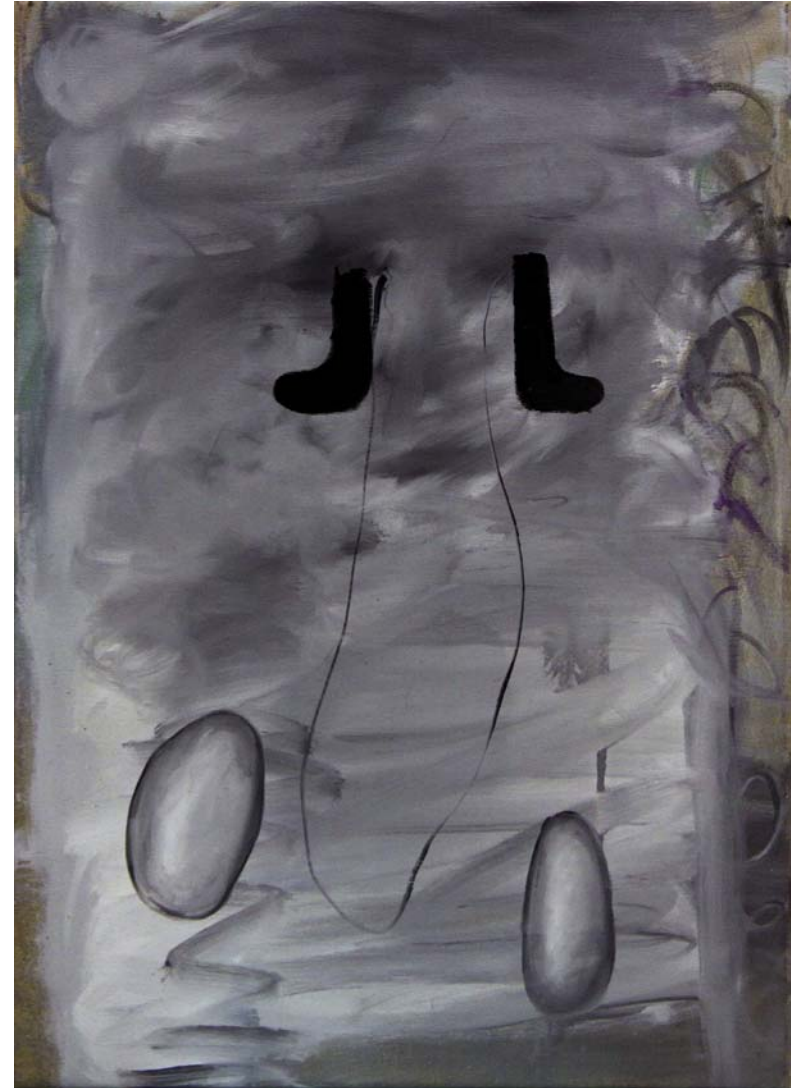
Entschuldigen Sie bitte, aber ich habe gerade meine Eier verloren 2011, Öl auf Leinwand, 66 x 47 cm