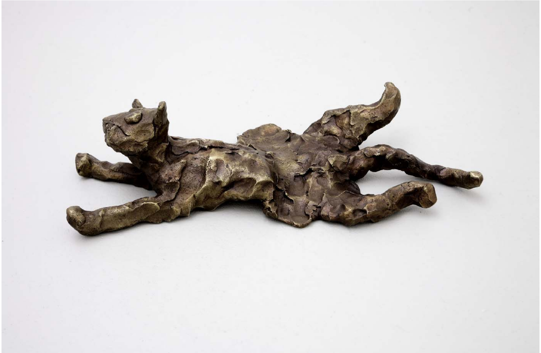
cobra gt, 2008, Bronzeguss, 12,5 x 45 x 20,5 cm, Edition of 5 + 1 EA