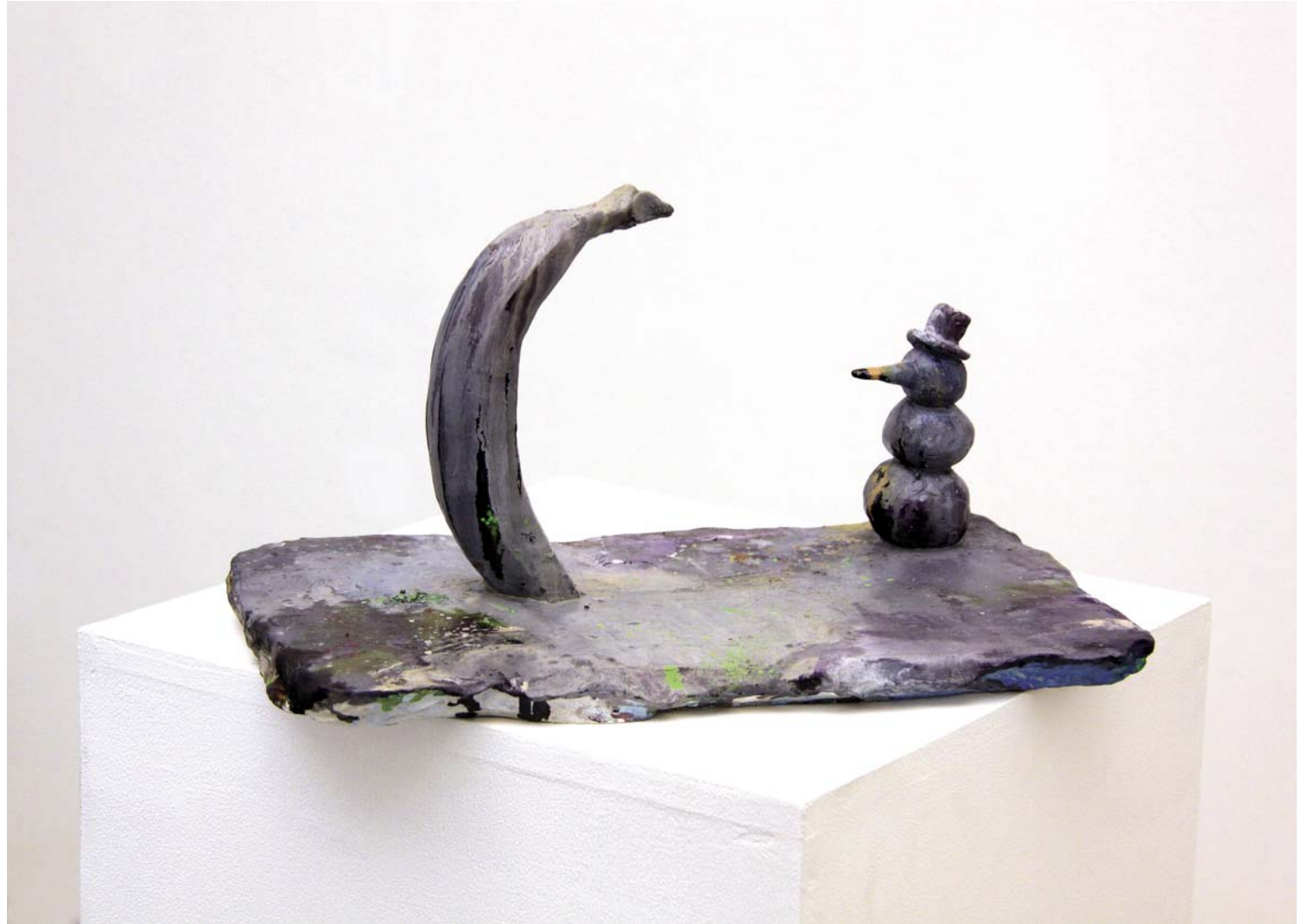
o.T., 2011, Objekt, Gipsguss, 41 x 23 x 23 cm, Unikat