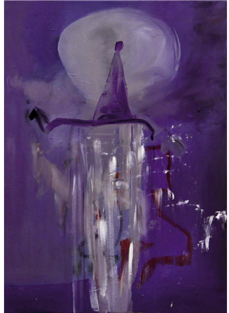
o.T. (Gnom), 2011, Öl auf Leinwand, 66 x 47 cm