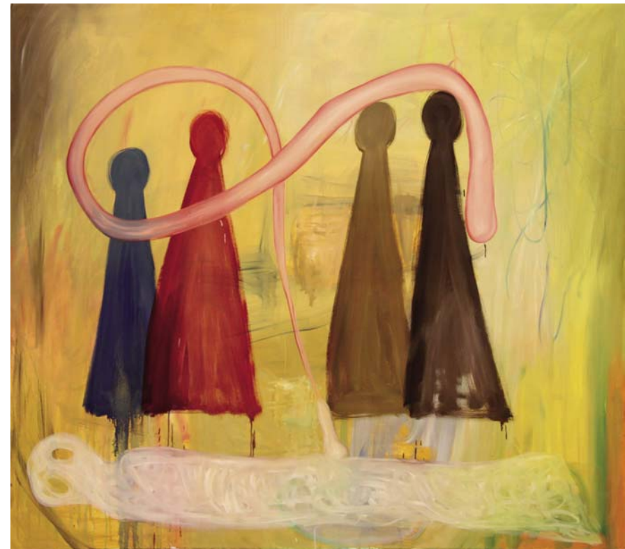
Familienaufstellung im kambodschanischen Geisterreich, 2011, Öl/Lw, 180 x 200 cm, courtesy artepari

Aus vier Pöppeln (in unseren Breiten auch „Manschgal“ genannt) über einem Spukgespenst wird auf jeden Fall die Familienaufstellung im kambodschanischen Geisterreich. Und wie es sich für einen freien und frechen Geist gehört, wird er bei einer obszönen Handlung gezeigt. Aus seinen zwei Löchern im Kopf scheint uns der Untote verstohlen anzublicken während sein wiederbelebter Unterleib ein kräftiges Lebenszeichen von sich gibt. Ein sich ektoplasmatistisch materialisierendes Ejakulat umkreist die arbiträren Familienpartizipanten in Form einer stilisierten liegenden Acht und verweist somit auf die unendliche Potenz des Substrats. Die Hormone scheinen niemals zu sterben und selbst Tote wiederzubeleben. Ob damit allerdings das Rätsel um den Ausstellungstitel gelöst ist, bleibt offen. Roman Grabner, 2011