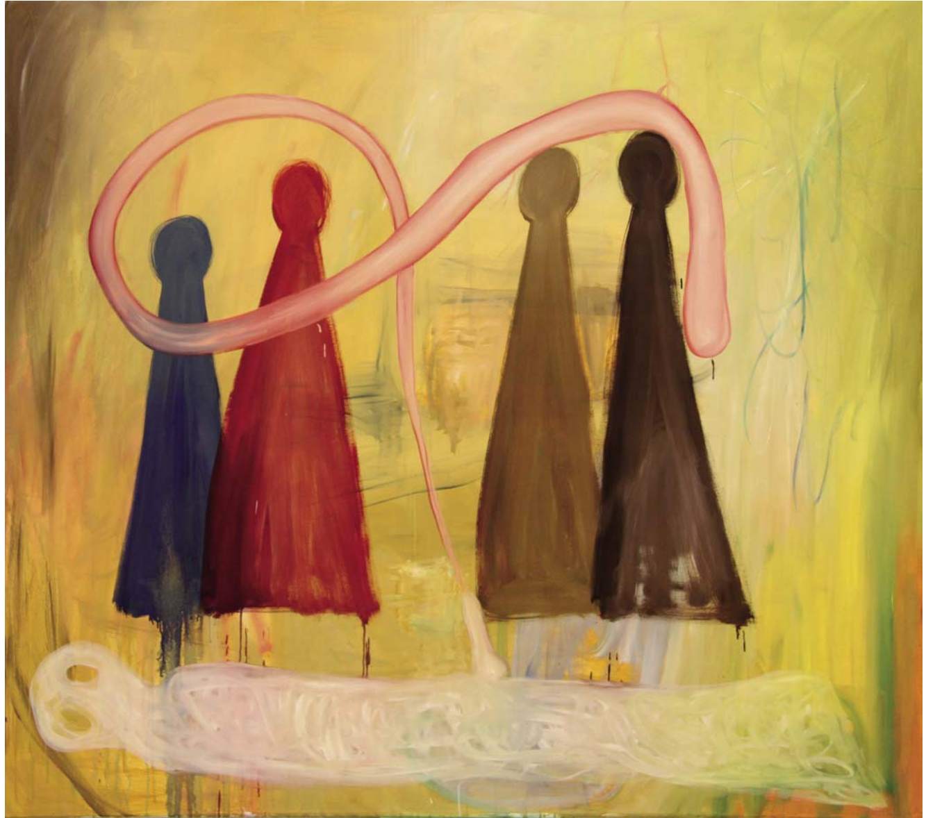
Familienaufstellung im kambodschanischen Geisterreich, 2011, Öl auf Leinwand, 180 x 200 cm