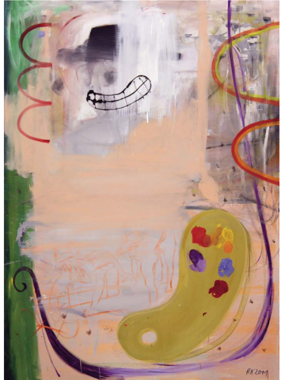
Schon wieder gescheitert beim Versuch einen Regenbogen zu malen 2011, Öl auf Leinwand, 140 x 100 cm