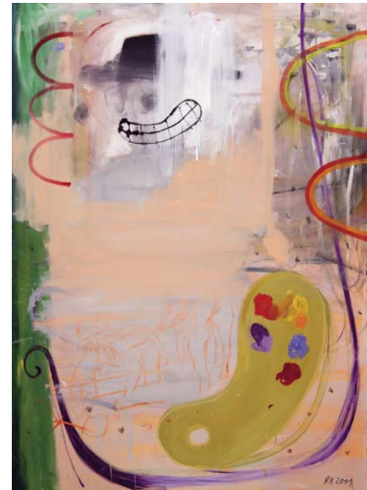
Schon wieder gescheitert beim Versuch einen Regenbogen zu malen, 2011, Öl auf Leinwand, 140 x 100 cm

Kodritsch scheint sich bei der Konstruktion seiner Bildwelten immer wieder auf den Bilderkosmos von Märchen, Mythologien bzw. auf naturreligiöse Vorstellungen als Inspirationsquelle zu beziehen. In seinen Gemälden tau-