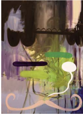
o.T. (Schnurrbart und Blase), 2011, Öl auf Leinwand, 140 x 100 cm, courtesy artepari