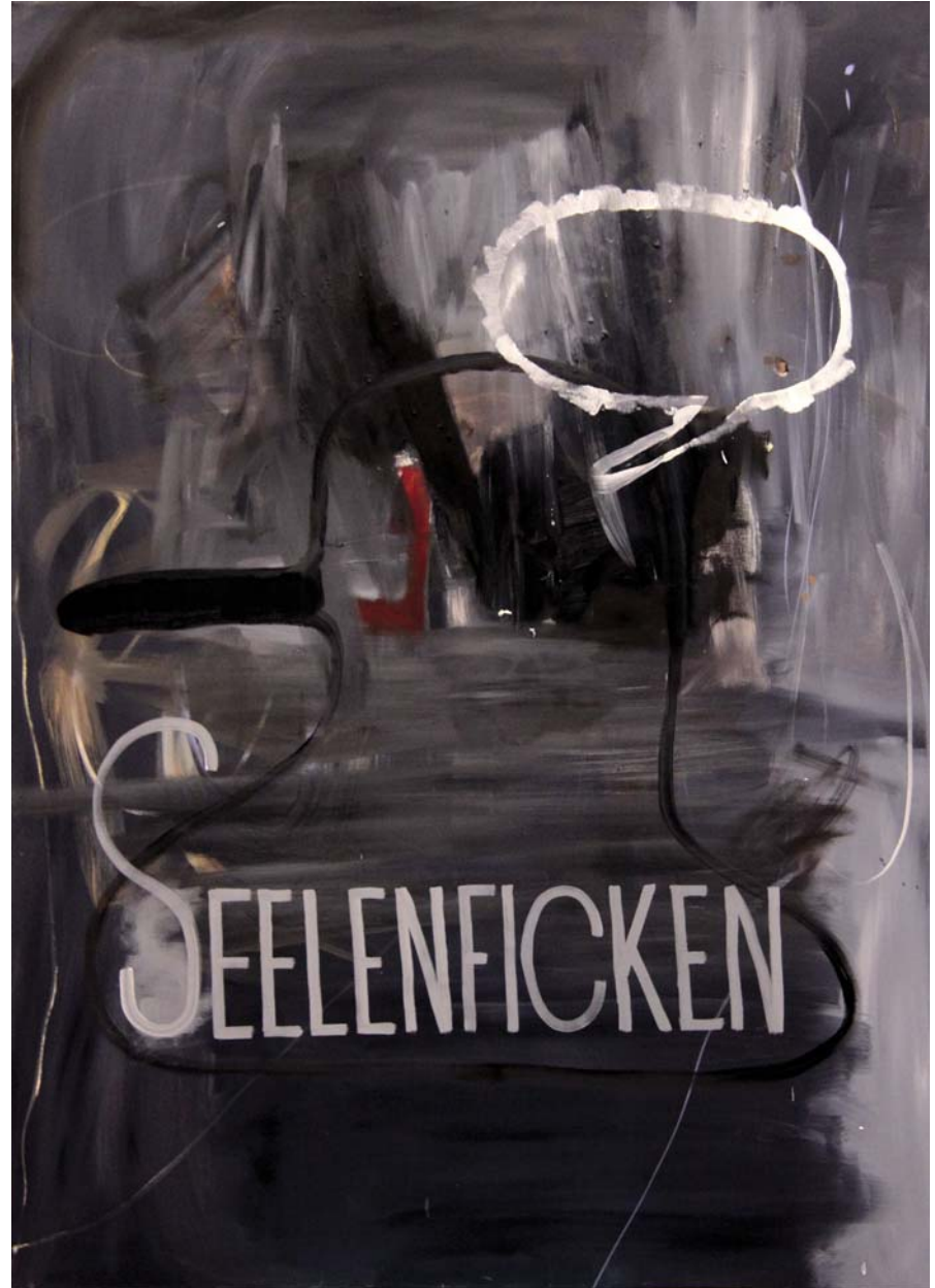
Seelenficken, 2011, Öl auf Leinwand, 140 x 100 cm