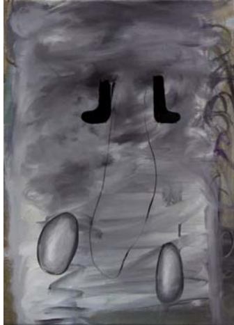
Entschuldigen Sie bitte, aber ich habe gerade meine Eier verloren, 2011, Öl auf Leinwand, 66 x 47 cm, courtesy artepari