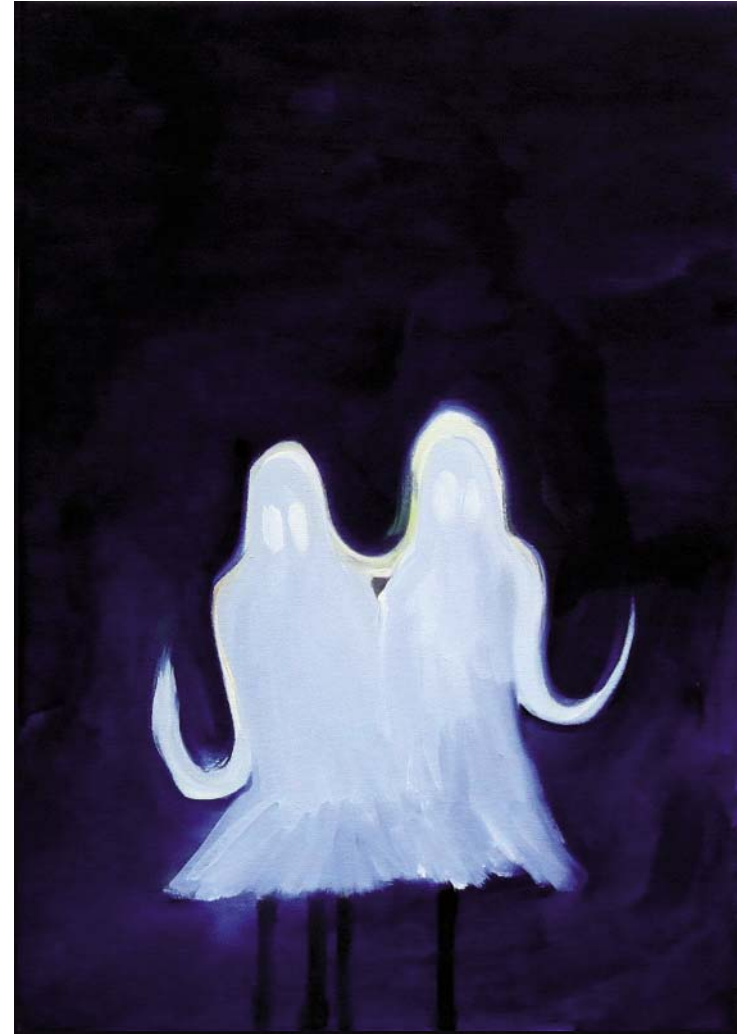
Sisters II, 2010, Öl auf Leinwand, 50 x 35 cm