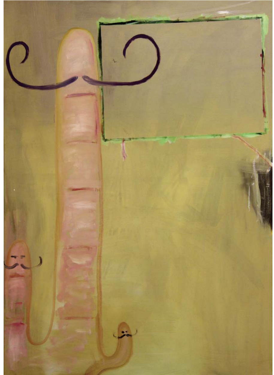
Skulptur mit Weitblick, 2011, Öl auf Leinwand, 140 x 100 cm