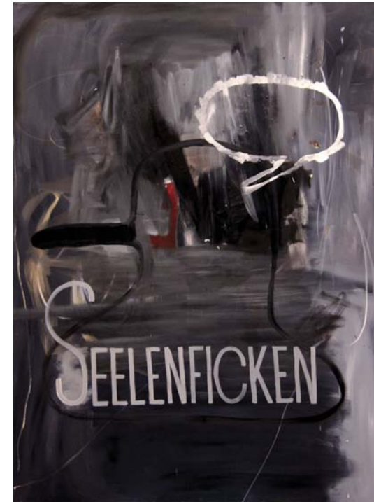
Seelenficken, 2011, Öl auf Leinwand, 140 x 100 cm

In seinem titelgebenden Gemälde hat er vor eine mit wildem Strich, tief aus der Palette der Grautöne schöpfende, gestisch aufgewühlte Folie eine seiner Blasenfiguren gesetzt. Jene Hybride zwischen Sprechblase, Schnuller und Hut mit schelmischer Pinocchionase, deren Länge nicht nur das Maß für den Ironiegehalt zu indizieren scheint, sondern auch ihre anzügliche Doppeldeutigkeit nicht ganz verhehlen kann. Das rote Kürzel im Zentrum des Bildes ist nicht nur farblicher Akzent, formalästhetische Setzung, sondern durchaus auch Strumpf oder verkehrtes „L“, wenngleich der Zusammenhang unklar bleibt. Eine leere Sprechblase scheint wie zum Hohn nur Bedeutungsleere hinzuzufügen und auf die offene Aussage des Bildes zu verweisen. „Bla Bla Blasen“ hat Kodritsch gleich einem Kommentar auf ein anderes Bild derselben Schaffensphase geschrieben.