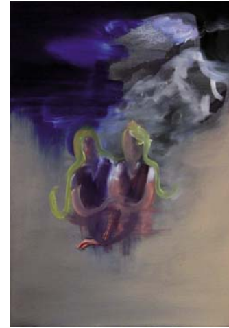
Sisters I, 2010, Öl auf Leinwand, 50 x 35 cm, courtesy artepari