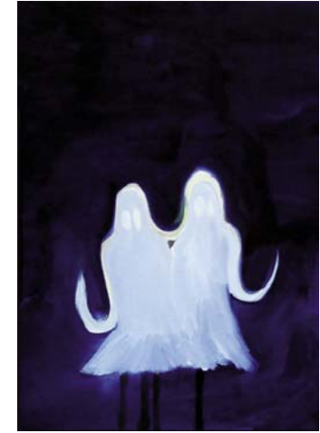
Sisters II, 2010, Öl auf Leinwand, 50 x 35 cm, courtesy artepari

chen Gespenster, Hexen, Gnome und Wiedergänger unterschiedlichster Couleur auf. Von medizinischer und wissenschaftlicher Seite wird derartigen Wiederkünften und Gespenstererscheinungen meist eine Sinnestäuschung unterstellt und eine Täuschung des Sinns bzw. eine Enttäuschung der Wahrnehmung darf man wohl auch bei Kodritsch als Intention vermuten.